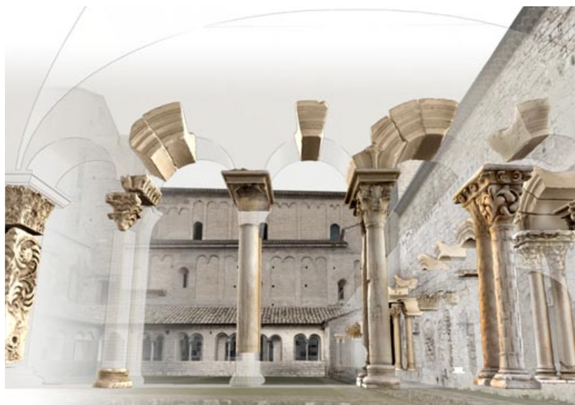
Le Cloître de l'Abbaye de Saint-Guilhem-le-Désert. Restitution 3d de l'état actuel et reconstitution numérique du cloître au XIIème siècle.