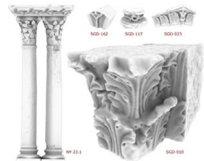
Numérisation d'éléments sculptés.

Cette étape vise à réunir dans un espace virtuel un ensemble significatif d'éléments représentant l'état des galeries sud et est du cloître au XIIe siècle.