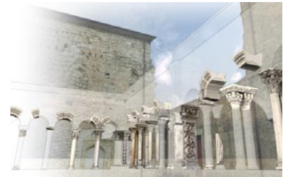
Reconstitution numérique du cloître au XII e siècle.

Les données recueillies et produites pendant les étapes de ce projet sont enfin intégrées à l'intérieur d'un dispositif de représentation qui associe la géométrie restituée à partir de la numérisation des objets réels à celle élaborée en interprétant les hypothèses formulées par les historiens : la représentation de l'état des galeries sud et est au XII e siècle est ainsi superposée à l'état actuel du cloître.