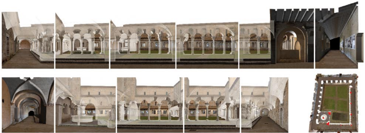
Reconstitution numérique des galeries Sud et Est.