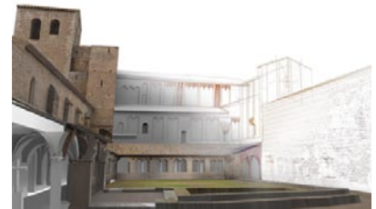
Restitution numérique 3D de l'état actuel.

Quatre phases distinctes (a,b,c,d) ont permis de reconstruire en trois dimensions le cloître avec une précision centimétrique depuis l'analyse métrique des volumes jusqu'à la représentation de l'apparence visuelle des détails.