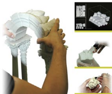
Maquettes physiques des éléments numérisés.

Ce projet a été l'occasion d'appliquer pour la première fois une méthodologie complète de structuration d'informations hétérogènes (métriques, morphologiques, géométriques, descriptives) au sein d'une base de données accessible sur Internet. Un tel système pourrait ainsi devenir demain un outil de référence pour analyser les objets en les manipulant à distance.