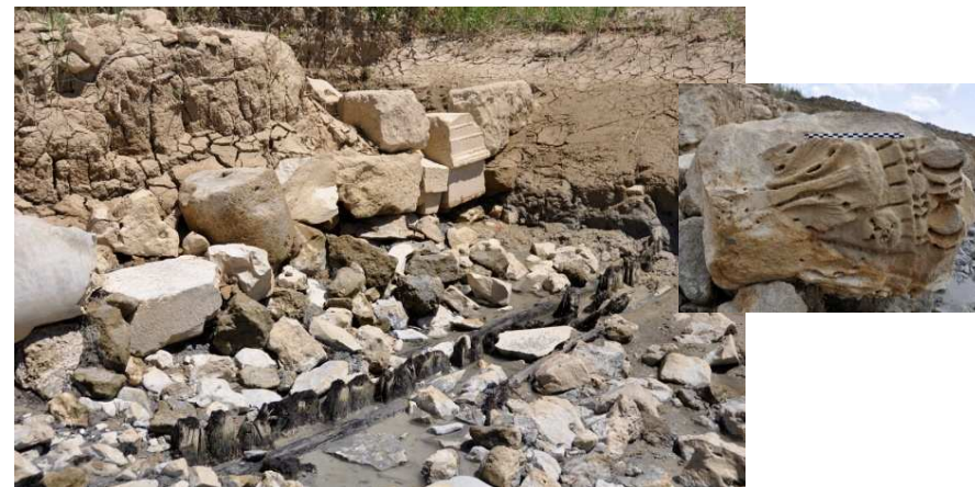
II – Narbonne